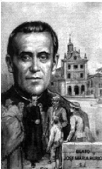
San José María Rubio

Semejante amor y sensibilidad hacia los pobres llevó a Santa Ángela de la Cruz a fundar su «Compañía de la Cruz», con una dimensión caritativa y social a favor de los más necesitados y con un impacto enorme en la iglesia y en la sociedad sevillanas de su época. Su nota distintiva era la naturalidad y la sencillez, buscando la santidad con un espíritu de mortificación, al servicio de Dios en los hermanos.