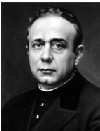
San Pedro Poveda

San Pedro Poveda captando la importancia de la función social de la educación, realizó una importante tarea humanitaria y educativa entre los marginados y carentes de recursos. Fue maestro de oración, pedagogo de la vida cristiana y de las relaciones entre la fe y la ciencia, convencido de que los cristianos debían aportar valores y compromisos sustanciales para la construcción de un mundo más justo y solidario. Culminó su existencia con la corona del martirio.