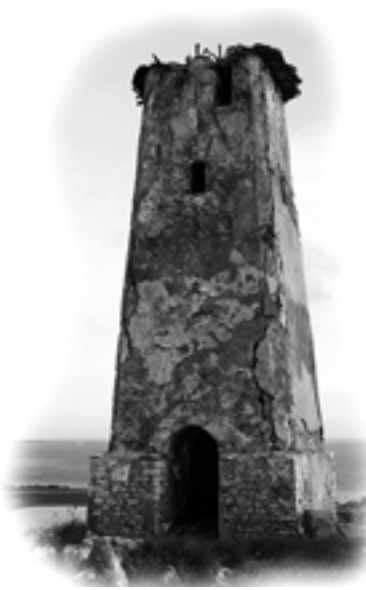
Faro antiguo de Los Roques

Estimado lector: Habiendo cumplido con la no fácil tarea de publicar 20 Boletines de Apuntes de Lectura Espiritual, frescos y variados, cumplimos con la promesa de entregarle el Boletín N° 1 con su faro aquí presente y algunos de sus artículos. Athletae Christi y su Consejo de Redacción agradecen la amable acogida que ha tenido esta publicación.