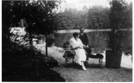
Suiza, en el exilio.